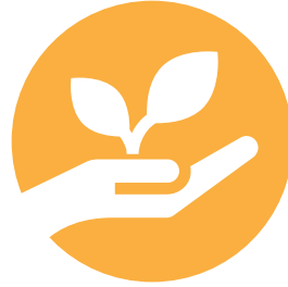
المستفيدين من الخدمات