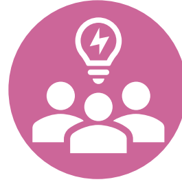
أعضاء مجلس الإدارة