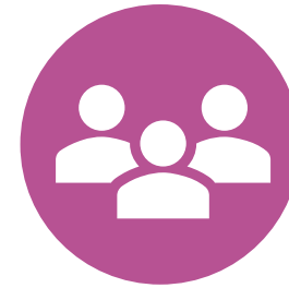
أعضاء الجمعية العمومية